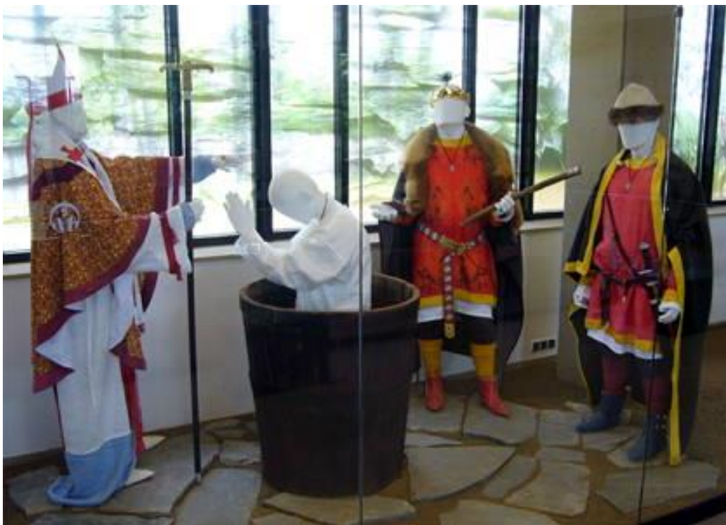
Obr. 3: Křest Bořivoje v Památníku Velké Moravy ve Starém Městě