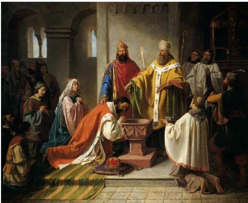
Obr. 5: Křest Bořivoje od malíře Marolda